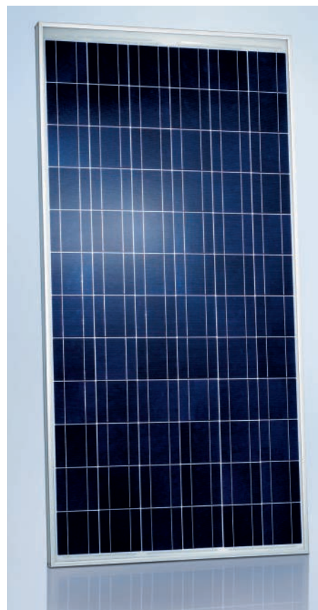
SCHOTT POLY™ 165/170/175/180